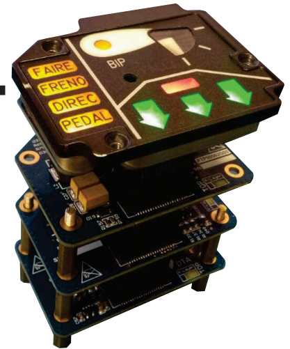
Despiece Panel de Configuración