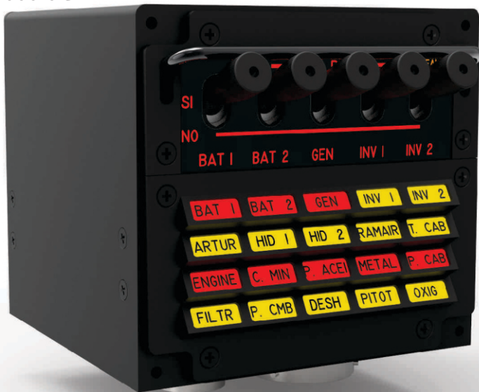
Panel de Alarmas Copiloto

Los paneles de alarmas, que equipan al avión IA-63 Pampa en el puesto piloto y copiloto, centralizan las alarmas WARNING y CAUTION que se generan en la aeronave, las cuales son anunciadas en forma luminosa mediante el encendido simultáneo en cada panel, de la indicación correspondiente, y en forma audible.